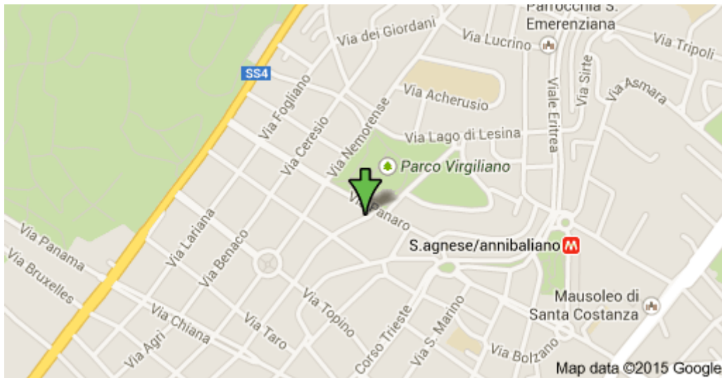
Via Volsinio, 23/25